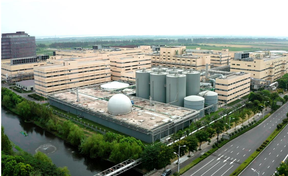
华东医药废水 EPC 总包项目

(2) 废气治理：公司的废气治理业务主要为医药化工、光伏原料及市政领域的生产过程中涉及的 VOCs（挥发性有机化合物）进行减排、处理与综合防治。公司主要通过综合运用“洗涤+吸附-脱附-溶剂回收”等核心技术，对有机废气进行吸附分离，并对分离的有机物进行回收再利用。