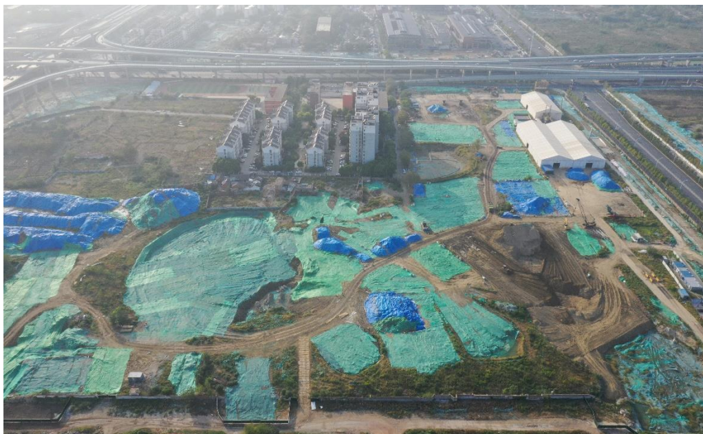
氯碱化工污染治理一期东二东三地块

壤及地下水修复领域内各种类型的工程，涉及铜、锌、铅、铬、镍、砷、锑等多种重金属，以及挥发性有机物（VOCs）、半挥发性有机物（SVOCs）、石油烃（TPH）等有机污染物。在达到土壤及地下水污染物修复目标的同时，减少“异味扰民”，实现高效绿色修复治理的目标要求。