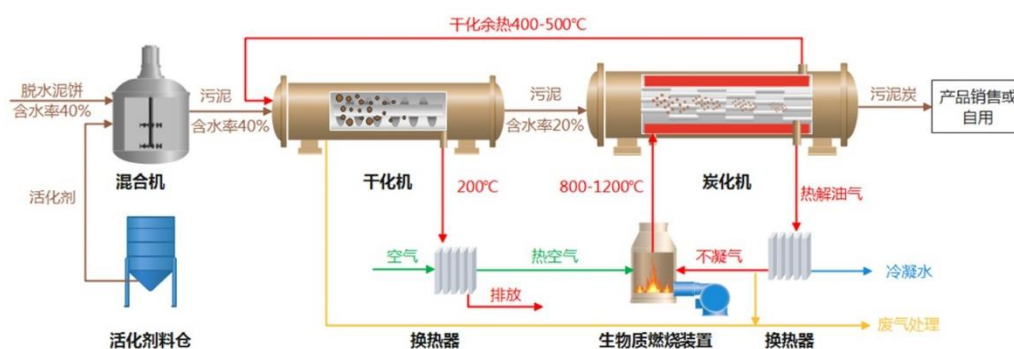
污泥炭化工艺流程图

环保产业正在由“无害化”向“资源化”转变的阶段，着力拓展资源化利用业务是公司重点发展战略。一方面，公司基于现有技术延伸，重点开展资源化利用方向的技术研发。如在针对污泥处理与处置领域的核心技术污泥生物淋滤深度脱水技术的基础上，就污泥基生物炭活化等延伸技术的开展研发工作。公司依托在废水治理领域的经验，就有机废水的无害化与资源化相结合工艺开展研发工作；公司可在污染土壤处置等方面的技术积累为基础，针对有机污染土壤绿色可持续修复关键工艺开展研发工作。另一方面，公司在积极探索产业投资机会，通过下设产业投资与发展部，围绕固废资源化、废水资源化方向进行重点拓展，寻求经济附加值高、收益曲线更稳定的产业投资延伸，从而形成有公司特色的资源化利用产业板块。