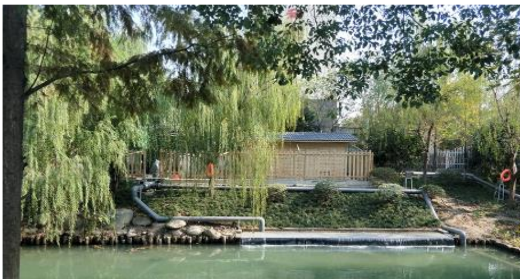
杭州市拱墅区褚家河智慧配水净化工程