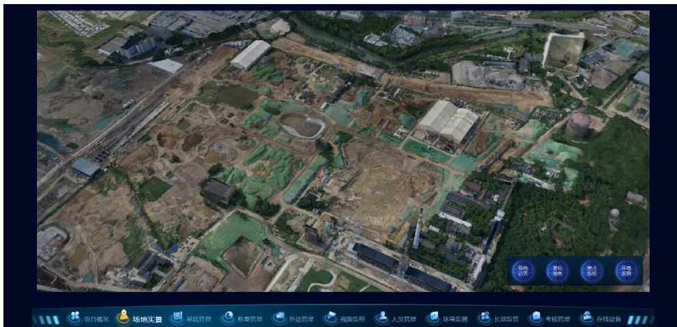
“智慧治土”数字管理平台场地实景管控

保产品已经在土壤修复和水环境治理方面初步完成并已投放市场使用，公司的综合服务能力得到进一步加强。