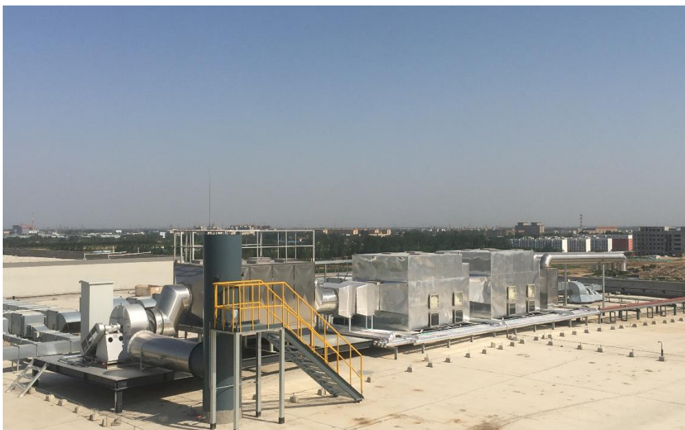
衡水以岭药业前处理车间和制剂车间末端废气处理工程

(2) 废气治理：公司的废气治理业务主要为医药化工、光伏原料及市政领域的生产过程中涉及的 VOCs（挥发性有机化合物）进行减排、处理与综合防治。公司主要通过综合运用“洗涤+吸附-脱附-溶剂回收”等核心技术，对有机废气进行吸附分离，并对分离的有机物进行回收再利用。