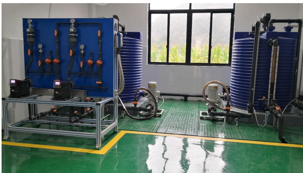
金华市浦江县外胡水厂