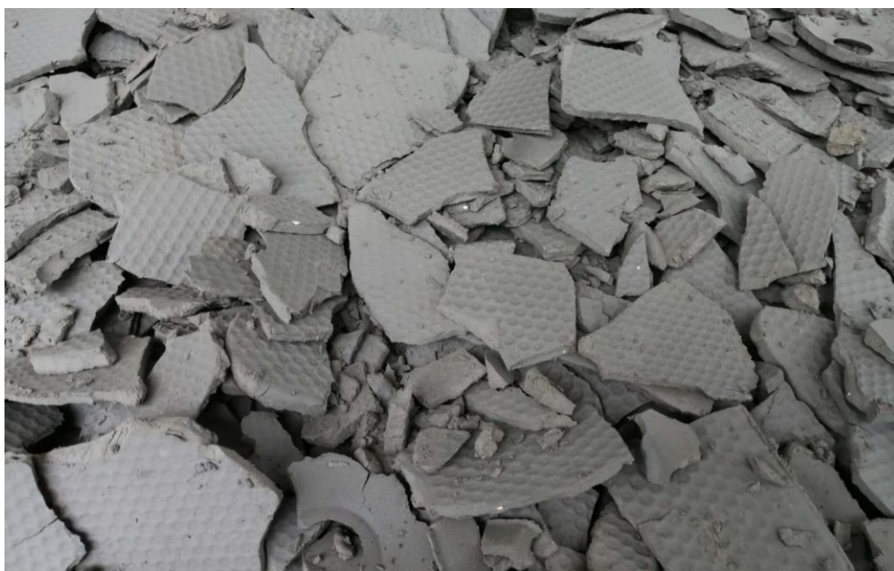
污泥淋滤深度脱水技术实物效果