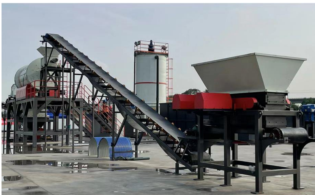
杭钢项目淋洗设备实景图

(2) 水体修复：针对水环境污染和水生态系统退化问题，公司开展的水体修复项目，采用生态措施和工程措施相结合的方法，控制水体污染、去除富营养化，重建水生态系统，恢复水生态系统功能。公司的核心技术“智能河道活水系统”，通过涵盖数据采集、水文水质耦合模型和大数据分析的水环境智慧管理技术，实现水环境智慧配水与智慧水质调控。