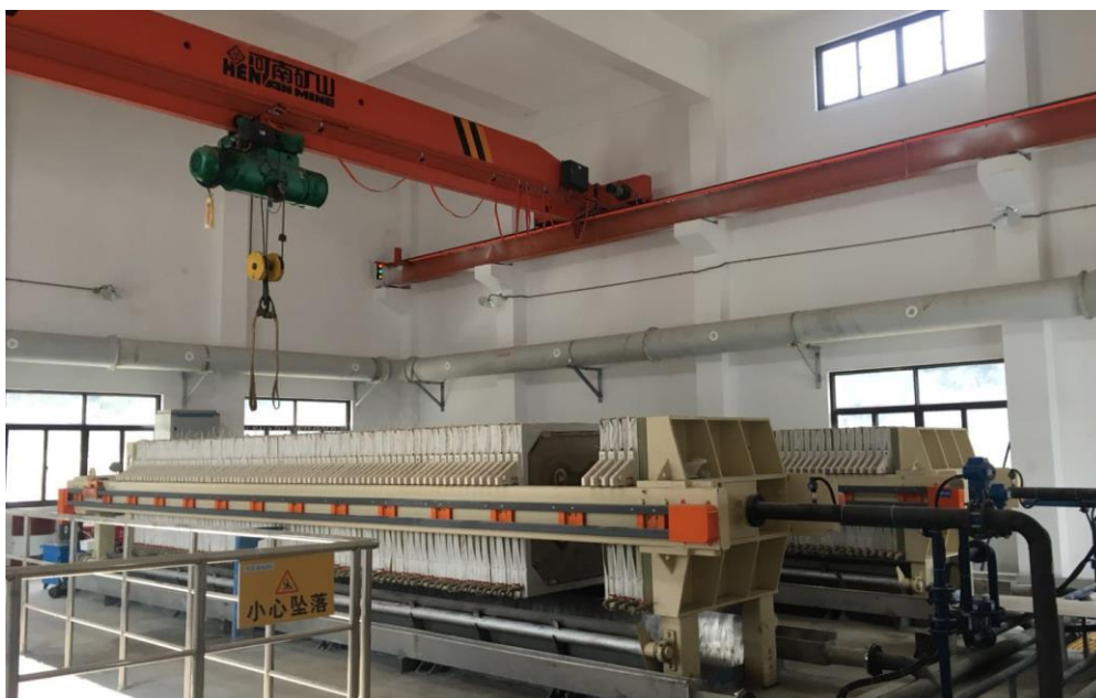
丽水庆元第二污水处理厂污泥深度脱水项目